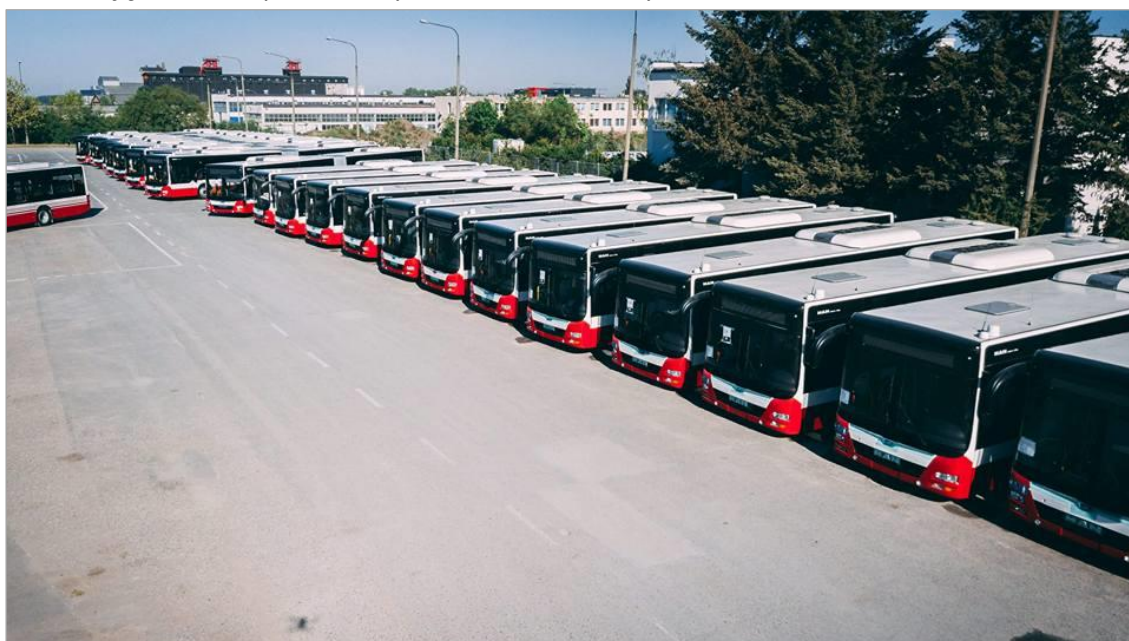
Zdjęcie 1: Zakupione, fabrycznie nowe autobusy dostarczone do MZK w 2018 roku

Miasto Opole realizowało w 2018 r. inwestycje w obszarze komunikacji miejskiej polegające na zakupie 28 fabrycznie nowych autobusów, w tym 15 autobusów przegubowych. Autobusy są napędzane silnikami diesla najnowszej generacji, które spełniają najnowszą normę Euro 6. Ponadto trwała budowa nowej zajezdni autobusowej w MZK Sp. z o.o. oraz rozstrzygnięto przetarg i podpisano umowę na wdrożenie biletu elektronicznego i zakup m.in. 10 szt. biletomatów stacjonarnych i 95 szt. biletomatów mobilnych, które będą zamontowane w każdym autobusie, a także 44 szt. tablic dynamicznej informacji pasażerskiej.