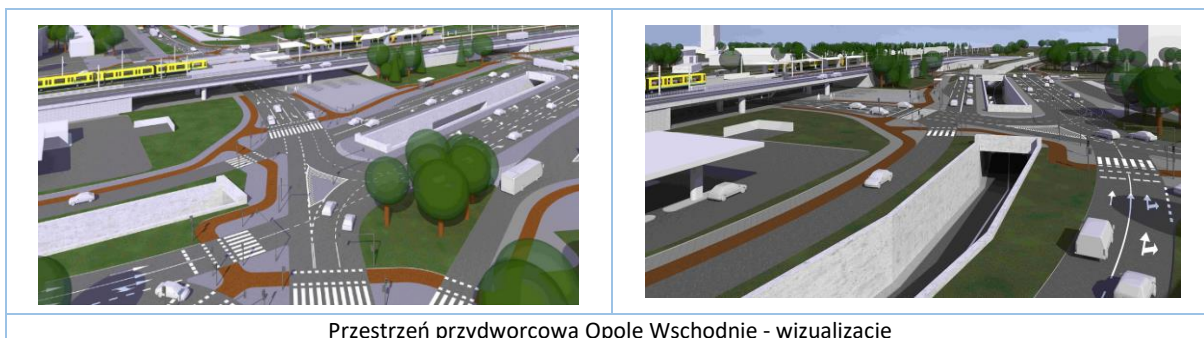
Przeźnię przydworcowa Opole Wschodnie - wizualizacje

W 2018 r. prowadzono również prace związane z budową Obwodnicy Piastowskiej - odcinek od obwodnicy północnej do ul. Krapkowskiej Etap II - od węzła Niemodlińska do obwodnicy północnej.