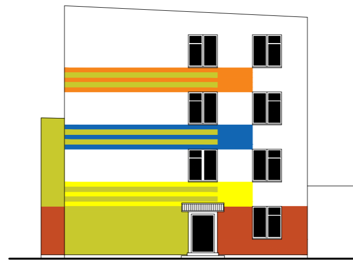
Elewacja wschodnia 1 : 200